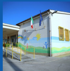
Scuola Primaria "San Lorenzo" Via San Lorenzo - Tel. 0873.59325